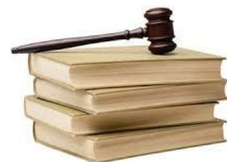
Lois de la bioéthique

...vers le brouhaha et tohu-bohu du mariage pour tous bis ? pourvu que tout ne tourne pas à la caricature...car il s'agira de manipulation du vivant...et il faudra bien tenir compte aussi de la situation actuelle des familles...tohu-bohu actuel : la génétique et la pédophilie...qu'il est difficile de réfléchir dans tout ce tintamarre médiatique !! J'aimerais bien me retirer sur la montagne ! mais nous sommes faits pour vivre dans le monde et pour le monde. PB